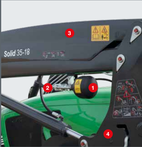
Comfort-Drive är skyddad i sitt läge mellan inkörningspelaren och lastarmen. Den kopplas till och från med spärrventilen.